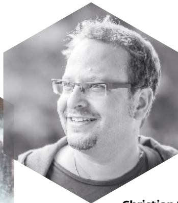
Christian Schmid Maler, Luzern www.schmidchristian.ch